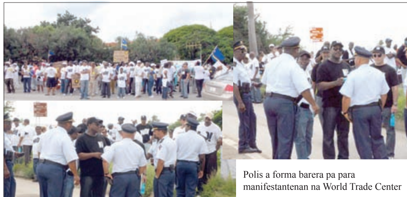
Polis a forma barera pa para manifestantenan na World Trade Center